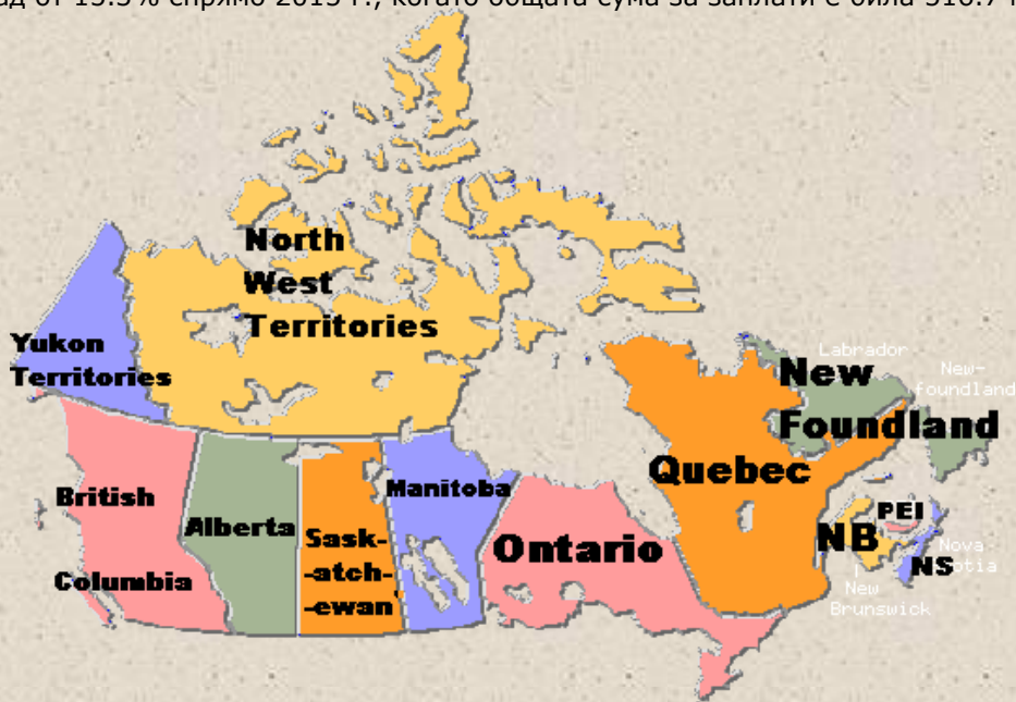
Компаниите от подсектора - по категории според броя наети лица по провинции и територии към 2016 г. (NAICS 3113)

През 2016 г., сумата за работни заплати на служителите от подсектора достига 437.4 млн. долара, бележейки спад от 15.3% спрямо 2015 г., когато общата сума за заплати е била 516.7 млн. долара.